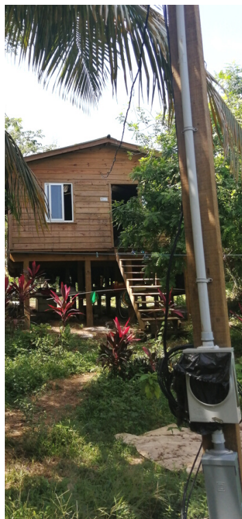
Imágenes del avance en los trabajos de instalación eléctrica y entrega de unidades sanitarias.