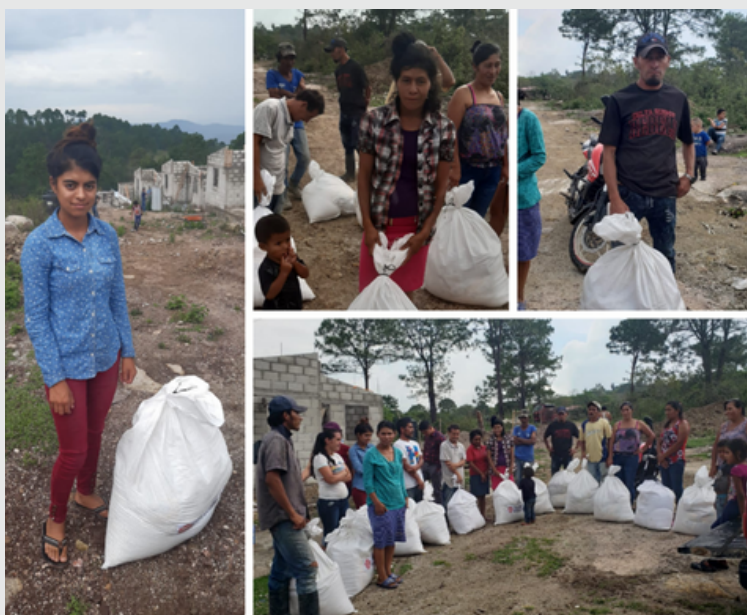
Familias durante la entrega de alimentos en Concepción, Copán.